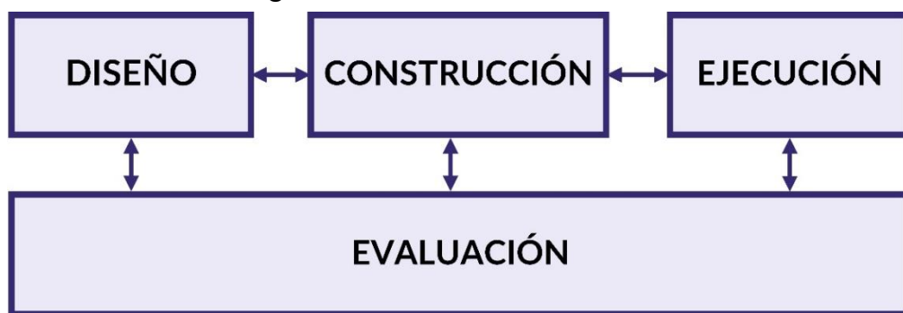
Figura 1: Ciclo de vida de una escape room educativa

El ciclo de vida para las escape rooms educativas propuesto y considerado en este documento se muestra en la Figura 1: